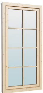
Fenster 0.84×1.885 м.3 шт.