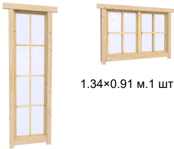
1.34×0.91 м.1 шт.