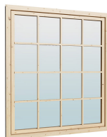
Fenster 1.62×1.885 м.1 шт.