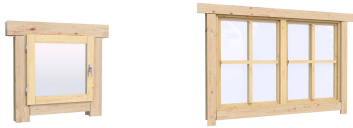
0.40×0.38 м.1 шт. 1.34×0.91 м.7 шт.