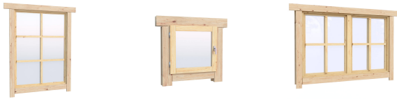
Fenster 0.87×1.17 0.40×0.38 м.2 шт. 1.34×0.91 м.3 шт. м.2 шт.