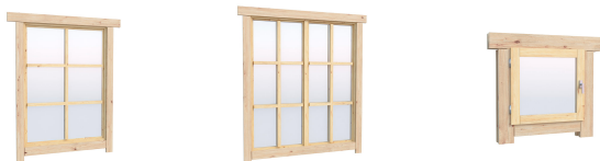
Fenster 0.87×1.17 м.3 шт. Fenster 1.34×1.17 м.1 шт. 0.40×0.38 м.1 шт.