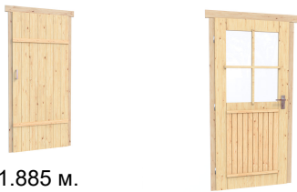
0.84×1.885 м. bath.2 шт.