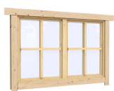
1.34×0.91 м.1 шт.