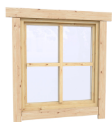
0.87×0.78 м.2 шт.